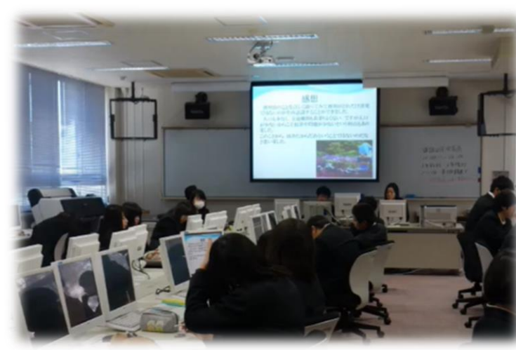
情報ビジネス (商業)