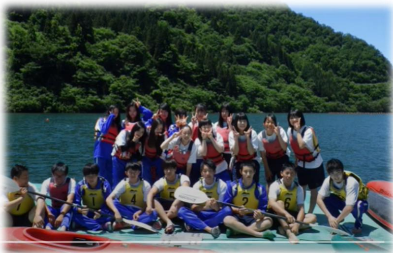
スポーツ科学 (体育)