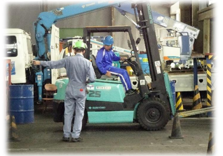
フォークリフト研修