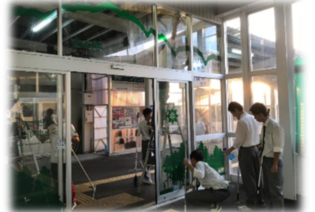
奉仕活動（上市駅清掃）